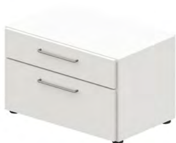
Liegenunterschrank - BS4S2