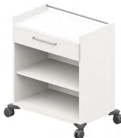
ISO-Wagen - BW9S1