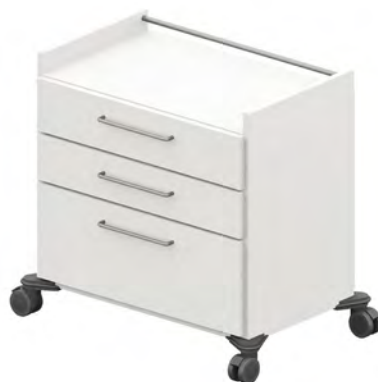
ISO-Wagen - BW7S3