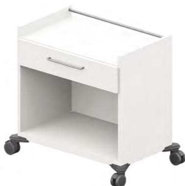
ISO-Wagen - BW7S1