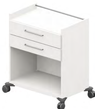
ISO-Wagen - BW9S2