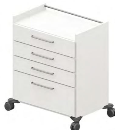
ISO-Wagen - BW9S4